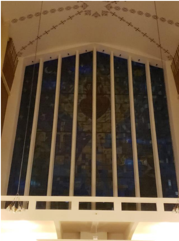
foto interna durante a noite.