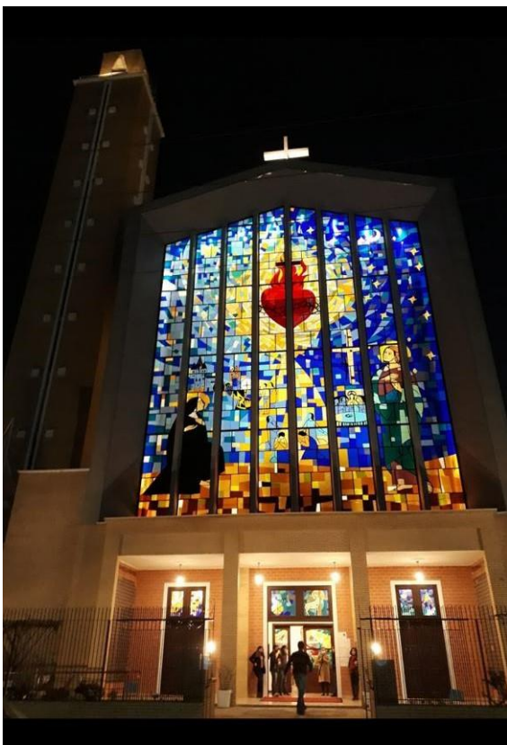
Foto externa durante a noite, com iluminação interna.