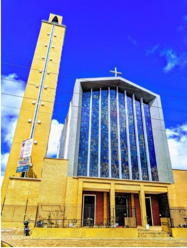
Foto externa durante o dia.